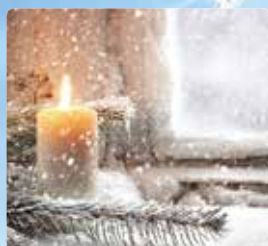
4 | РОЖДЕСТВО Рождественский праздник