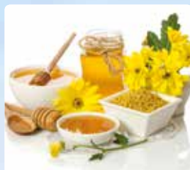
8 | ЗДОРОВЬЕ Такая обманчивая «сладкая» жизнь