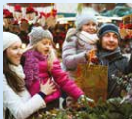
14 | СЕМЕЙНЫЕ ЦЕННОСТИ Фамильные традиции

Непериодическое печатное издание ТРВС «Три Ангела».